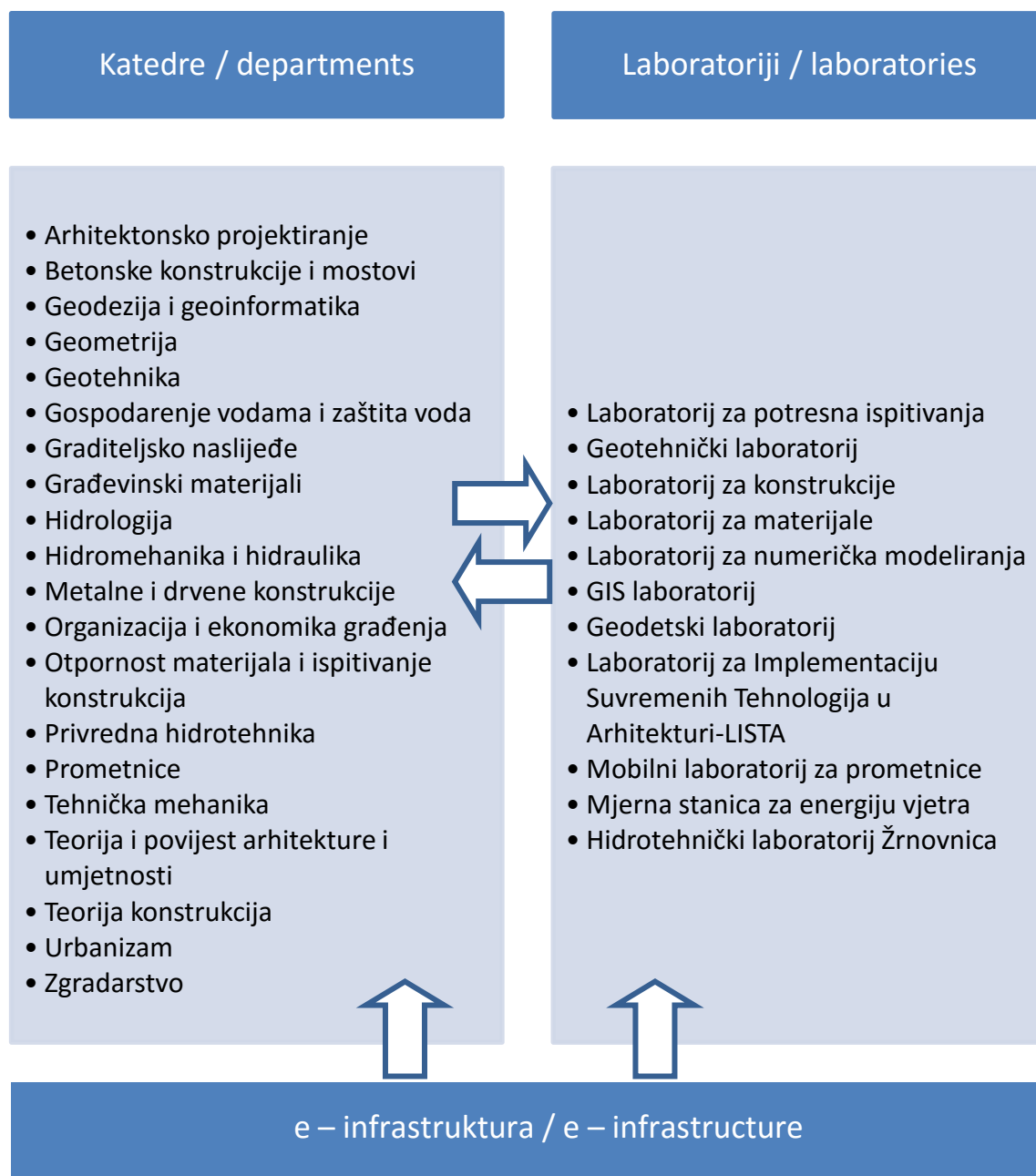
Slika 2. Organizacijska struktura FGAG-a

Laboratoriji ovisno o znanstvenoj temi istraživanja provode istraživanja za jednu ili više istraživačkih grupa i/ili istraživačkih tema, odnosno jedna istraživačka grupa ili tema može angažirati više laboratorija. Slika 2 prikazuje shemu organizacijskih jedinica unutar kojih se provode istraživanja. Uz hardverski dio, istraživačku infrastrukturu gradi i e-infrastruktura kao softver uz određenu opremu te dio koji predstavlja 'servis' svim grupama i laboratorijima (npr. zajedničke baze podataka, Virtual Private Server – SRCE, GIS podrška, programi za numeričko modeliranje, statističku analizu i sl.).